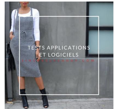
Tests applications et logiciels